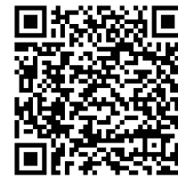
VR-SecureGo-App für Android