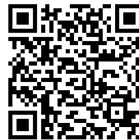
VR-SecureGo-App für iOS